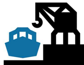
eta portuko jarduera

Hala ere, Nerbioi-Ibaizabaleko estuarioan honako hauek ditugu: