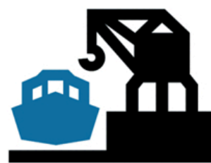
eta portuko jarduera

Hala ere, Nerbioi-Ibaizabaleko estuarioan honako hauek ditugu: