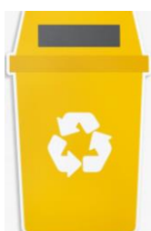
Reciclaje | Reutilización